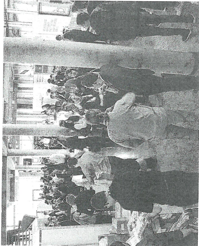
Großer Andrang bei der Karrierebörse der Hochschule in Sigmaringen.

Facility Services AG, iT Engineering GmbH, Knoll Maschinenbau GmbH, KUMAVISION AG, Lattemann & Geiger Dienstleistungsgruppe GmbH, Lidi, Losan Pharma GmbH, M + W Group, MAHLE Ventiltrieb GmbH, Manz AG, MARC O'POLO International GmbH, Marquardt GmbH, Mettler-Toledo (Albstadt) GmbH, nemetris GmbH, NNE Pharmaplan GmbH, OPTIMA packaging group GmbH, PAUL HARTMANN AG, Robert Bosch GmbH - Packaging Technology, SCHAEFER GmbH, SCHOTT Schweiz AG, Schwäbische Werkzeugmaschinen GmbH, SysDesign GmbH, Teva-ratiopharm, TRANSPOREON GmbH, TRUMPF Laser GmbH, ZF TRW Aktive & Passive Sicherheits-technik TRW Automotive Electronics & Components GmbH, Uhlmann Pac-Systeme GmbH & Co. KG, Versandhaus Walz GmbH, Vetter Pharma-Fertigung GmbH & Co. KG, Winterhalter Gastronomie GmbH, ZOLLERN GmbH & Co. KG