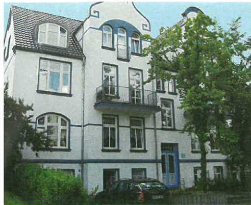
Adler Real Estate: mit Immobilien auf Platz eins gelandet