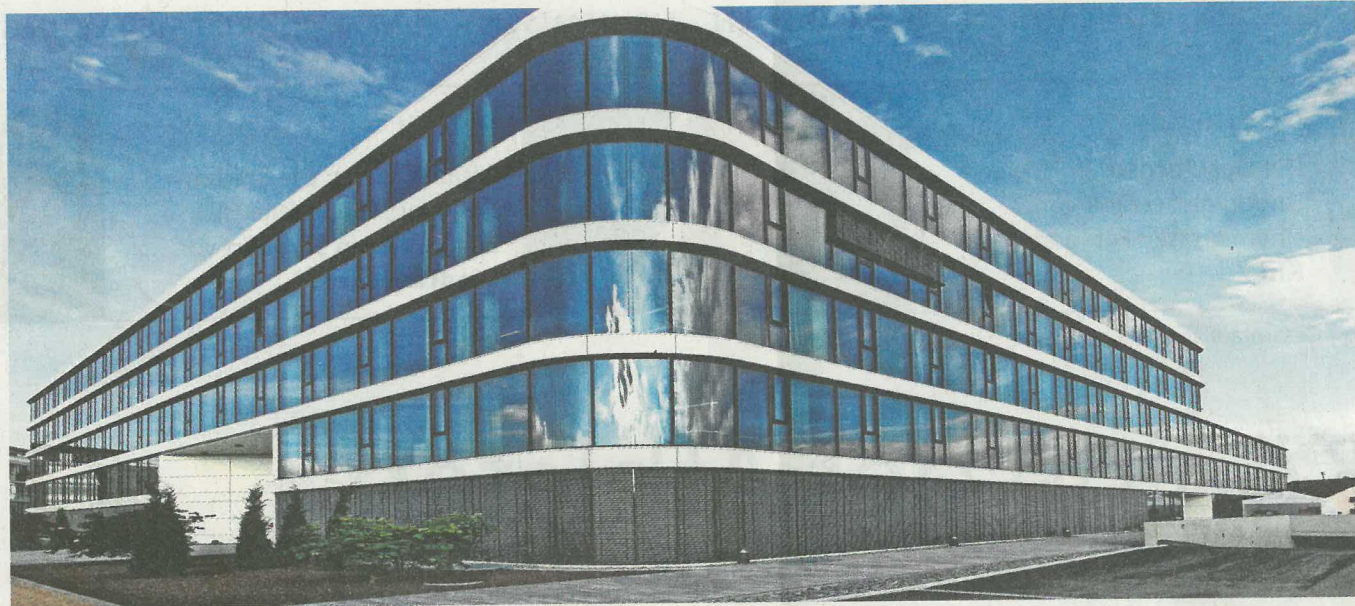
Das Airport Business Center 4 in der Rita-Maiburg-Straße besteht aus einem teilweise dreigeschossigen Baukörper Richtung Süden und einem fünfgeschossigen Baukörper Richtung Norden.

„Die Verwendung hochwertiger Materialien und Oberflächen, welche mit spielerischen und teilweise unkonventionellen Details verbunden werden, sowie grafische Elemente an Wänden und Decken spiegeln die lebendige und auf Fortschritt bedachte Unternehmenskultur wider und tragen so einen wesentlichen Teil zur identi-