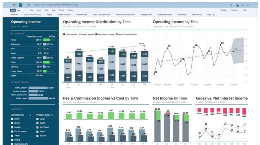
Business Intelligence: Datenüberblick mit Self-Service-Analysen (Quelle: SAP)

Die SAC vereint als einziges Produkt drei unterschiedliche Funktionen (Business Intelligence, Planning & Predictive), die Sie durch eine einheitliche und benutzerfreundliche Oberfläche verwenden können.