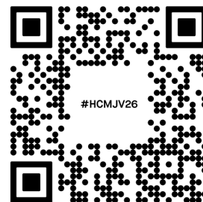
Foto- und Videoaufnahmen

Wir weisen darauf hin, dass auf der Veranstaltung Foto- und Videoaufnahmen erstellt werden, um die Veranstaltung zu dokumentieren, eine entsprechende Nachberichterstattung zu betreiben und nachfolgende Veranstaltungen zu bewerben.